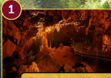
1 Cuevas de Mendukilo-ko Kobak

Visitas guiadas y servicios - Verano 2017 / bisita gidatuak eta zerbitzuak, 2017ko Uda