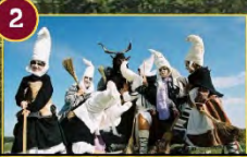
2 Sala ENIGMA BASABURUA