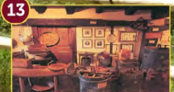
13 Museo de la Miel Ezkurdí Erlezaintza Museoa