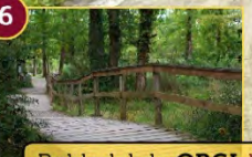
6 Robledal de ORGI-ko haritzia