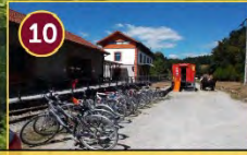
10 Bicicletas Kantina Bizikletak