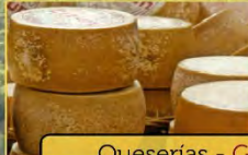
7 Queserías - Gaztandegiak "Bikain", "Antsoenea", "Anatxonea"