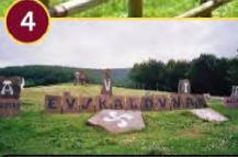
4 Parque PERU-HARRI Parkea