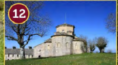
12 Santuario de San Miguel de Aralar Santutegia