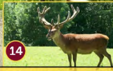
14 Ciervos en libertad Lesakenea Orein askeak