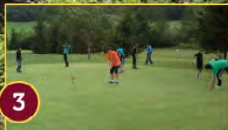
3 Pitch & Putt LIZASO - Golf en familia / Golf familian